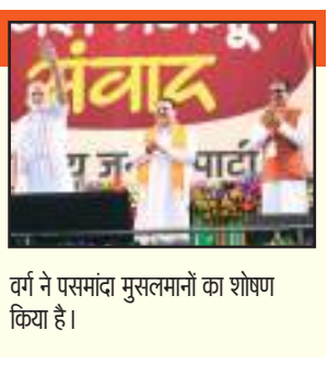
वर्ग ने पसमांदा मुसलमानों का शोषण किया है।

मुस्लिम भाई-बहन हैं। वोट बैंक की राजनीति करने वालों ने इनका तो जीना मुश्किल करके रखा है। वे तबाह हो गए, कोई फायदा नहीं मिला। कष्ट में गुजारा करते हैं। उनकी आवाज सुने के लिए कोई तैयार नहीं। उनके ही धर्म के एक