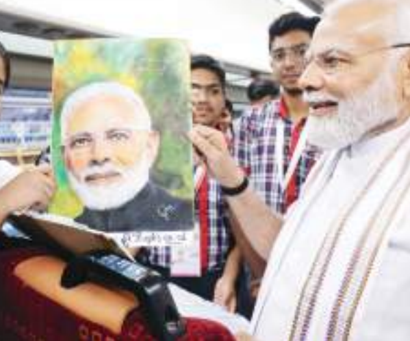
वंदे भारत ट्रेन को हरी झंडी दिखाने से पूर्वी ट्रेन में प्रधानमंत्री नरेंद्र मोदी बच्चों से बात करत हुए और अपना ऑटोग्राफ दिया।

टीएम एक्शन इंडिया/नई दिल्ली केंद्रीय स्वास्थ्य एवं परिवार कल्याण मंत्री डॉ. मनसूख मांडविया ने मंगलवार को स्वास्थ्य मंत्रालय और डीजीएचएस के वरिष्ठ अधिकारियों के साथ अमरनाथ यात्रा पर जाने वाले श्रद्धालुओं के लिए स्वास्थ्य सेवाओं और पर्याप्त गुणवत्ता वाली स्वास्थ्य सुविधाओं की समीक्षा की। केंद्र शासित प्रदेश जम्मू-कश्मीर को