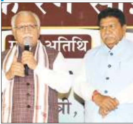
हरियाणा के सीएम मनोहर लाल एक कार्यक्रम को संबोधित करते हुए।